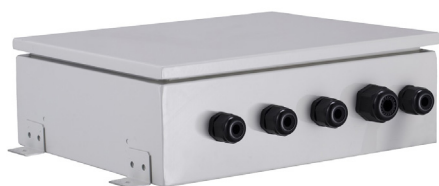
Boîtier de contrôle

Une interface qui permet de connecter des unités de traitement d'air disposant d'une batterie à détente directe aux unités extérieures de GMV. Chaque kit CTA est équipé d'une vanne, d'un détendeur électronique et d'une télécommande. Ce kit complet (sonde et télécommande fournies) est utilisé pour traiter la température de l'air de ventilation.