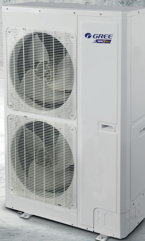
GMV5 MINI 120 - 140 - 160