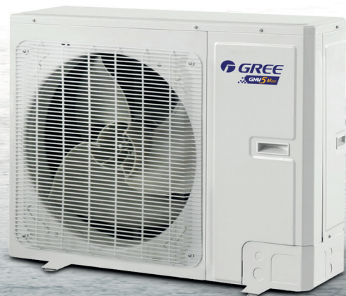
GMV5 MINI 121 - 141